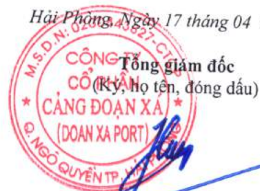
Trần Việt Hùng