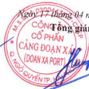
Trần Việt Hùng